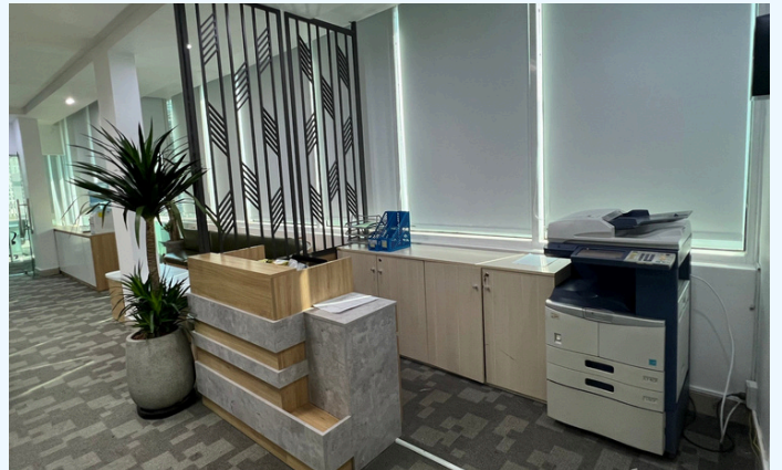
Không gian văn phòng Nguyễn Công Trứ