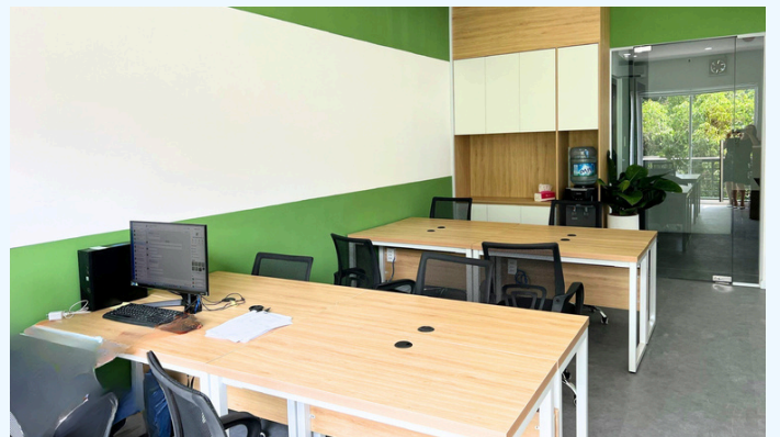
Không gian văn phòng Điện Biên Phủ